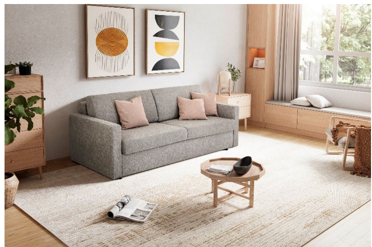
Funktionale Sofas sind flexibel einsetzbar und vereinen Praktikabilität mit Gemütlichkeit.