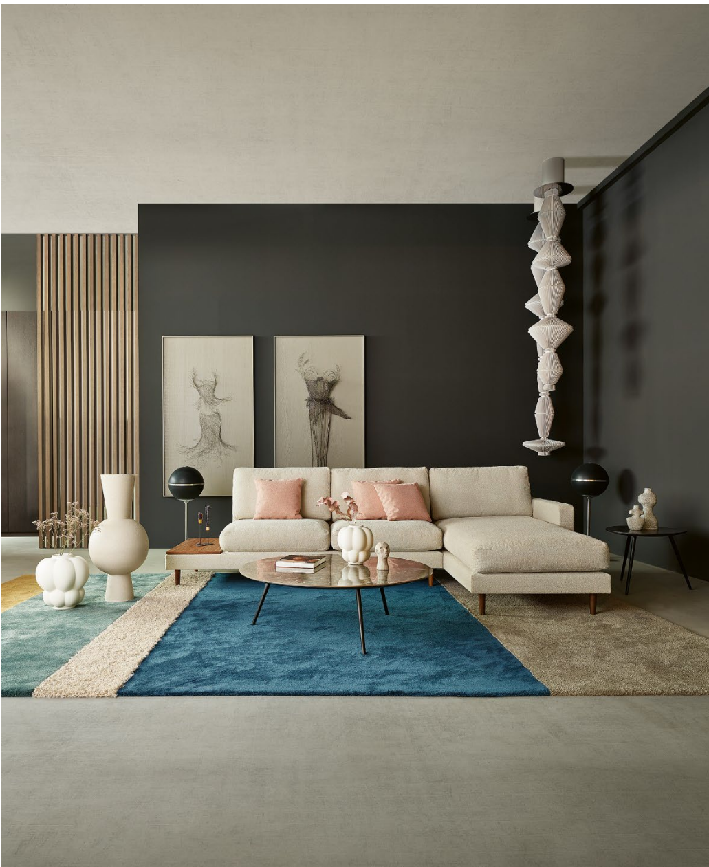
Flexible Möbel bieten gestalterische Vielfalt und passen sich den Ansprüchen der Bewohner an.