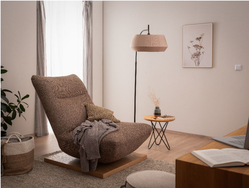
Gemütliche Rückzugsorte aus Österreich