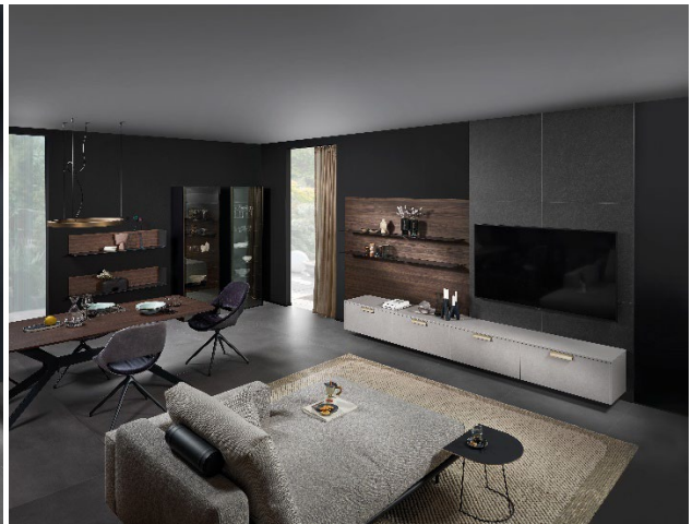
Küche und Wohnen verschmelzen zu einem Lebensraum.