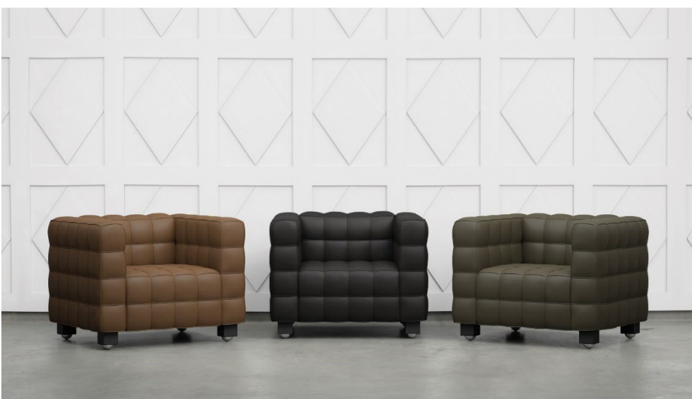
Designikonen und Retro-Stil modern interpretiert