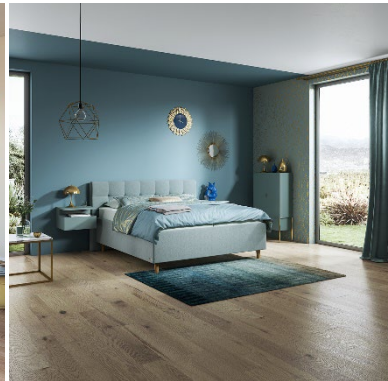
Optimaler Schlafkomfort und modernes Interior Design gehen Hand in Hand.