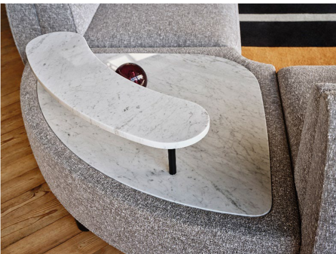
Sorgsam verarbeitete, hochwertige Materialien