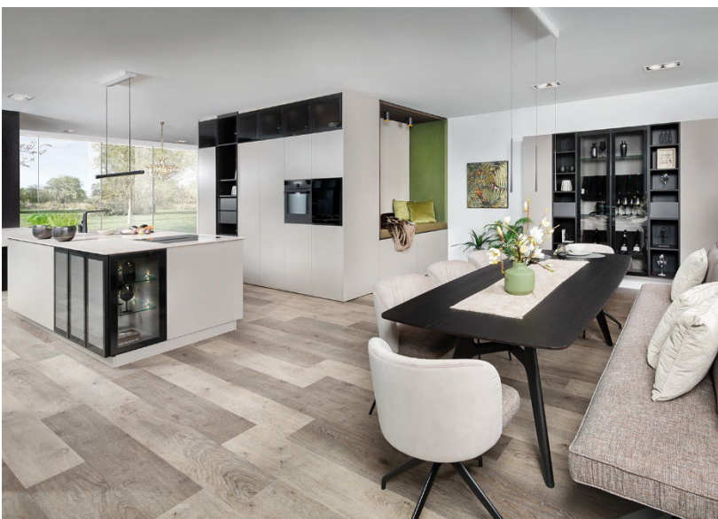
Dank maßgefertigter Raumkonzepte wird Wohnen immer individueller.