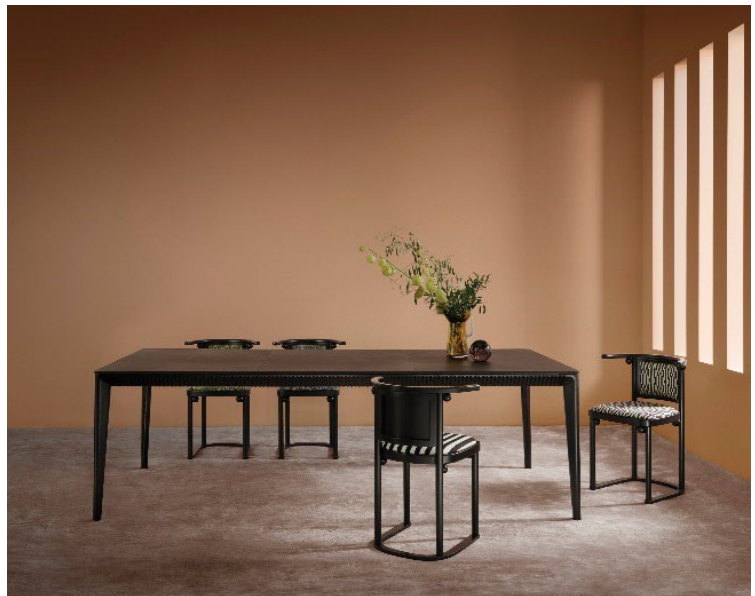
Trend- und Pantone-Farbe „Mocha Mousse“ (© Wittmann)

Die Farbwelt des Jahres ist geerdet und klar: Naturtöne wie Sand, Beige, Moosgrün und Terrakotta dominieren. Ergänzt werden sie durch sanfte Pastell-Nuancen wie Lavendel und Peach sowie wenige satte Akzentfarben wie Smaragdgrün und Bordeaux. Diese Palette strahlt Ruhe aus und fördert das Wohlfühl. Charme, Gemütlichkeit und Wärme bringt auch die Pantone-Farbe 2025 ins Zuhause: „Mocha Mousse“ – ein sanfter, erdiger Brauntönen, der zeitlose Eleganz und Behaglichkeit verkörpert. Dieser Ton harmonisiert hervorragend mit natürlichen Materialien und schafft eine beruhigende Basis für vielfältige Einrichtungskonzepte. Ob in minimalistischen Räumen oder in Kombination mit opulenten Akzenten – „Mocha Mousse“ wird zum verbindenden Element moderner Wohnwelten, um eine harmonische und stilsichere Atmosphäre zu erzeugen.