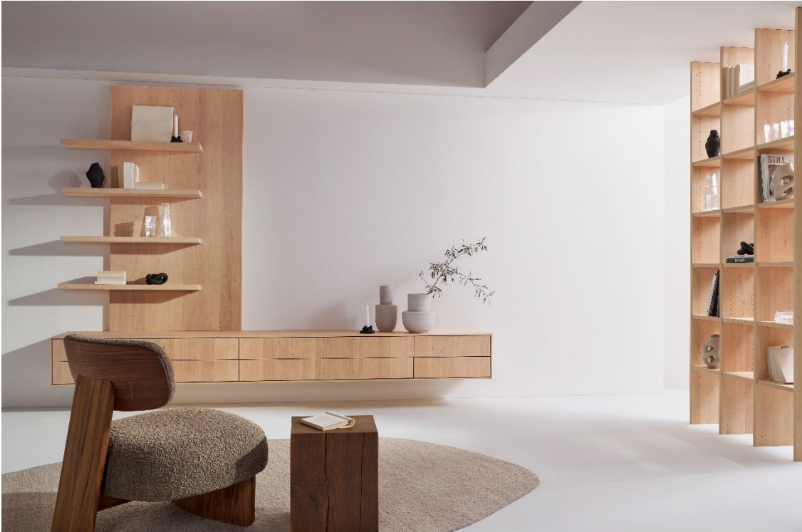
Aus dem natürlichen Werkstoff Holz werden Naturschönheiten für den Interior-Bereich geschaffen.

Die Lebenswelten der Menschen werden immer vielfältiger und individueller. Räume dienen längst nicht mehr nur als Orte des Wohnens, sondern werden zu Ausdrucksformen persönlicher Werte, Bedürfnisse und Stile. In der Gestaltung moderner Wohnkonzepte zeigt sich dabei ein spannendes Zusammenspiel: Auch in klaren, minimalistischen Designs setzen Einzelstücke mit Retro-Charme Akzente, die das Wohlfühl steigern und eine persönliche Note verleihen. So prägen dynamische Kontraste, aber auch der Wunsch nach Wohlbefinden die Interior-Welt 2025. Zugleich wird der Lebensstil vieler Menschen immer bewusster – von der Wahl natürlicher Materialien über eine nachhaltige Produktion bis hin zu durchdachten Kreislaufkonzepten. Die österreichischen Hersteller greifen diese Entwicklung auf und integrieren innovative Verfahren, die langlebige Lösungen mit anspruchsvollem Design verbinden.