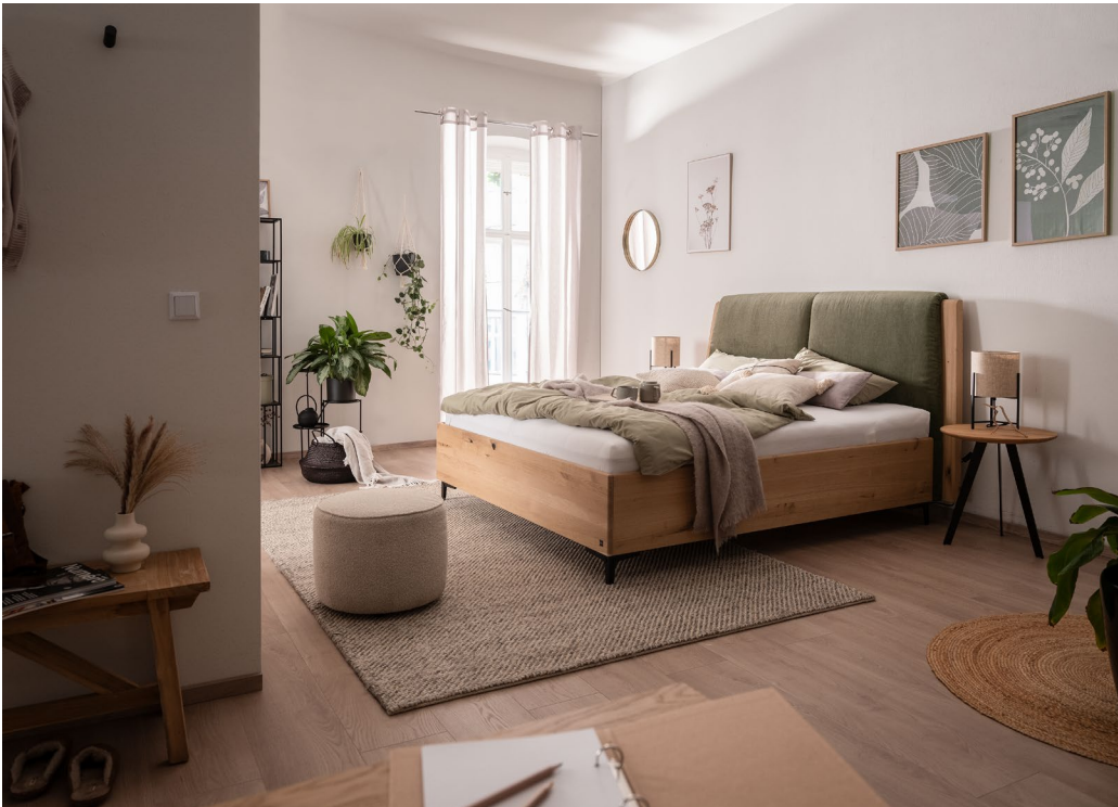
Ein Schlafzimmer mit vielfältigen natürlichen Elementen sorgt für gesunden Schlaf und gute Luft.

warmen Nuancen sowie strukturierten und glatten Oberflächen, die dem Raum zusätzlich Tiefe und Charakter verleihen.