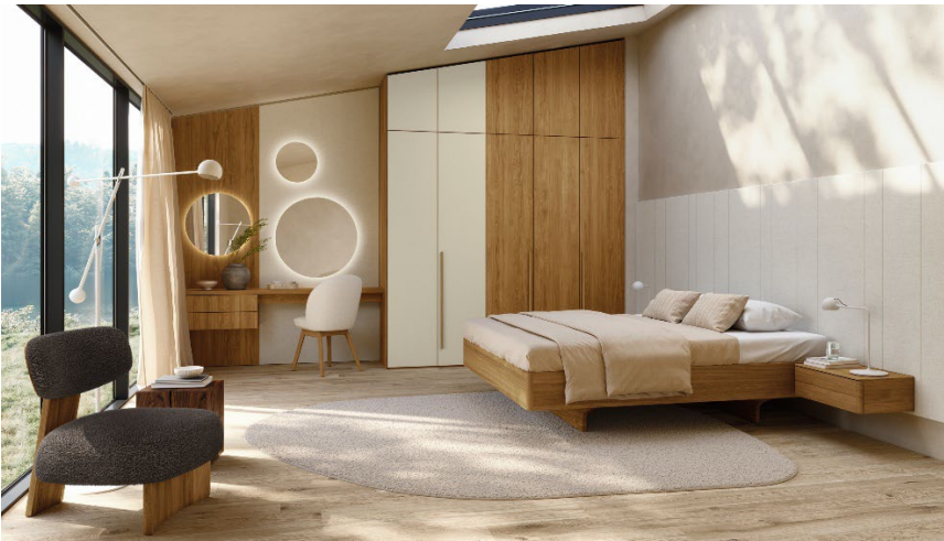
Ein nachhaltiger, bewusster Lebensstil trifft auf modernes Interior Design.