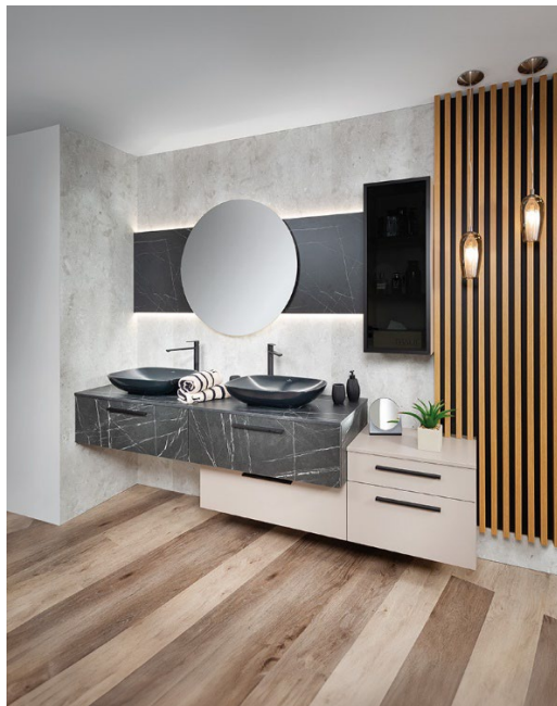
Von der Küche bis zum Badezimmer wird die Einrichtung auf die Raumarchitektur abgestimmt. (links/© HAKA, rechts/© P.MAX )